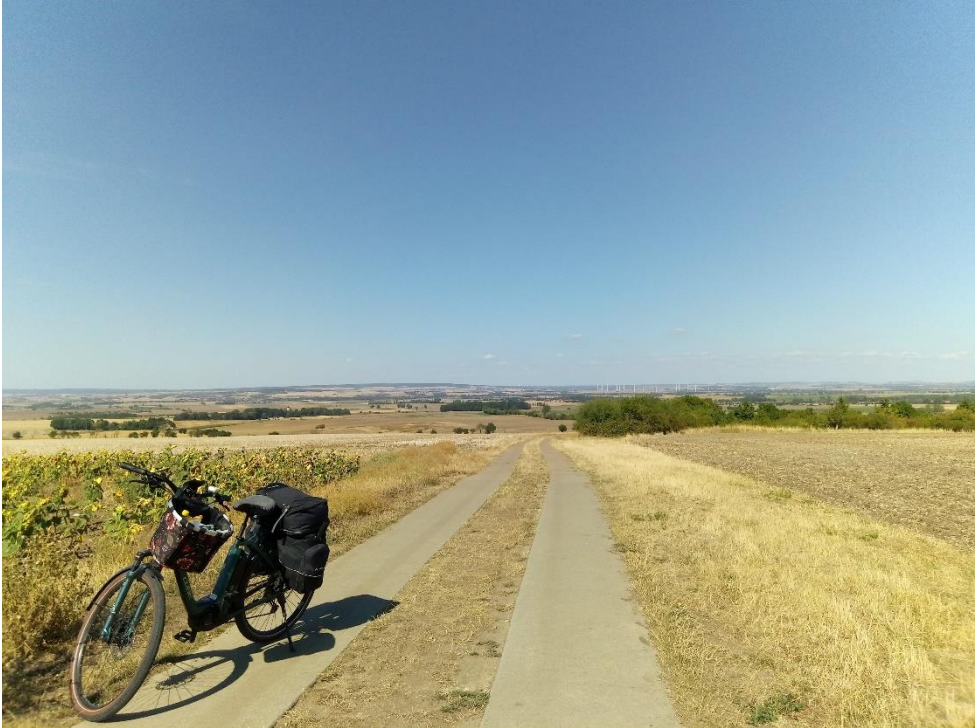
Radweg in der Nähe von Wernigerode

Möge die Straße uns zusammenführen und der Wind in deinem Rücken sein; sanft falle Regen auf deine Felder und warm auf dein Gesicht der Sonnenschein. Und bis wir uns wiedersehen, halte Gott dich fest in seiner Hand.