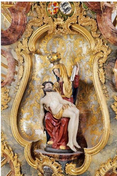
Das Gnadenbild von Maria Vesperbild